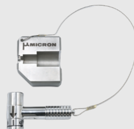
M85-002 トルクレンチセット